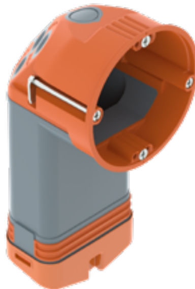
Típus: HE 74-L Cikkszám: 2003828