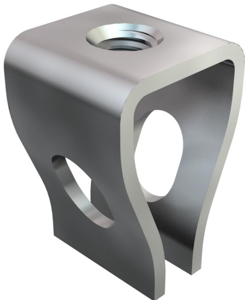
Rabic függesztőszem M6