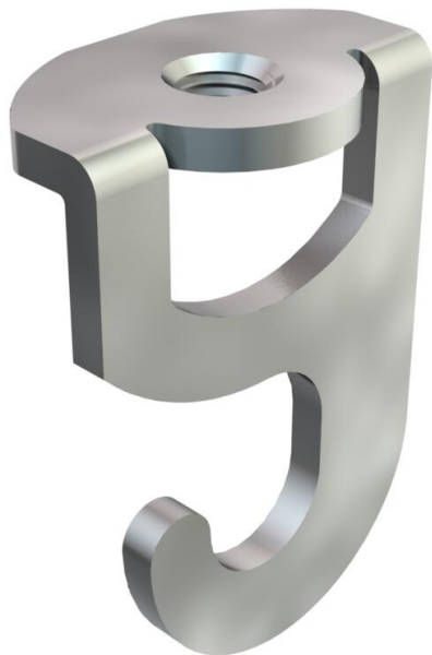
TS mennyezeti horog metrikus menettel